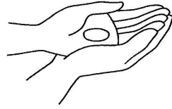
Table dressée sur nos chemins, Pain partagé pour notre vie ! Heureux les invités au repas du Seigneur ! Heureux les invités au repas de l'amour !

Toi l'Agneau de Dieu qui enlèves le péché du monde Donne-nous la paix (bis)